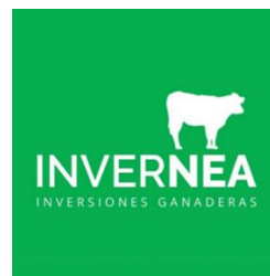
INVERNEA S.R.L. como Operador Técnico