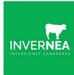
INVERNEA S.R.L. como Operador Técnico